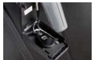
こちらは見本ですので同じ鍵ではございません。